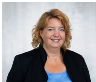
Heike Würth Sekretariat

Tel.: +41 61 375 95-03 gabriele.ochner@vsud.ch Arbeits-, Gesellschaftsrecht & Datenschutz